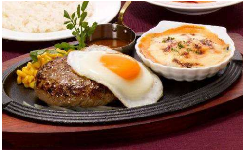
『170g 国産 黒×黒ハンバーグステーキ &帆立と海老のコキールグラタン』 【単品】 1,380 円(税込 1,449 円) 873kcal 【セット】 1,680 円(税込 1,764 円)

旨みの強い帆立と海老をバターでグリルし、醤油ベースのご飯によくあうソースで仕上げました。レモンを搾るとさっぱりいただけます。紙鍋でクツクツと最後まで温かくお召し上がりください。