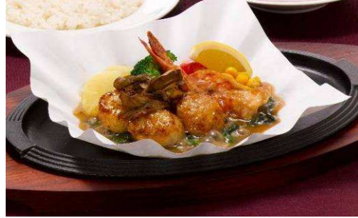
『帆立と海老のあつあつグリル 温野菜添え』 【単品】 1,380 円(税込 1,449 円) 400kcal 【セット】 1,680 円(税込 1,764 円)

ビーフシチューと並び洋食屋の定番で知られるタンシチューをハンバーグにのせて鉄鍋で提供。柔らかく煮込んだ濃厚な味わいのタンシチューとハンバーグのコラボレーションをお楽しみください。