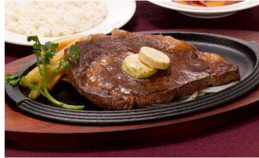
『240g国産牛リブロースステーキ』 【単品】 1,980 円(税込 2,079 円) 1293kcal 【セット】 2,280 円(税込 2,394 円)

人気の黒×黒ハンバーグと、濃厚な海老の香りがつまったソースで仕上げた、北海道産帆立と海老のグラタンのコンビネーションです。