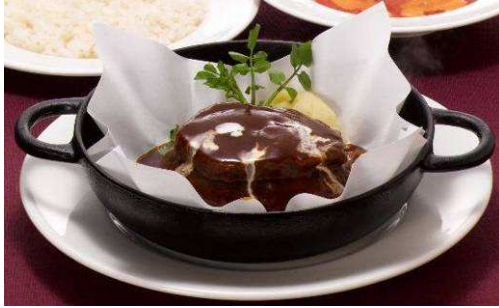
『鉄鍋タンシチュー&ハンバーグステーキ』 【単品】 1,480 円(税込 1,554 円) 962kcal 【セット】 1,780 円(税込 1,869 円)

寒い冬のおすすめとして、ステーキやハンバーグ、グリル、煮込み料理といったロイヤルホスト自慢の洋食メニューをご提供いたします。サラダ、ライス(又はパン)のセットがおすすめです。