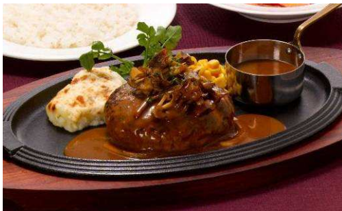
『210g国産 黒×黒ハンバーグステーキ ～ブラウンバターソース～』 【単品】 1,080 円(税込 1,134 円) 814kcal 【セット】 1,380 円(税込 1,449 円)

やわらかく旨みのあるリブロースステーキ 240g を、パセリガーリックバターとだし醤油でお召し上がりください。ステーキがお好きな方におすすめです。