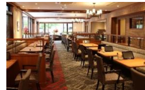
2023年4月開店 直営新店舗 光が丘 IMA 店