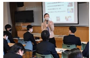
中学校への派遣授業の様子

これらの施策により、変化の激しい時代にも対応できる企業として、引き続き“日本で一番質の高い食 & ホスピタリティ”の提供に努めてまいります。