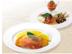
商品イメージ（2023年事例）