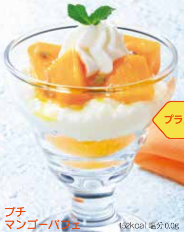
プチ マンゴーパフェ