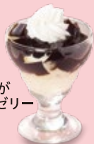
ほろにが カフェゼリー