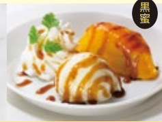
プチチェリージュビリー風 スイートポテトとバニラブルボン