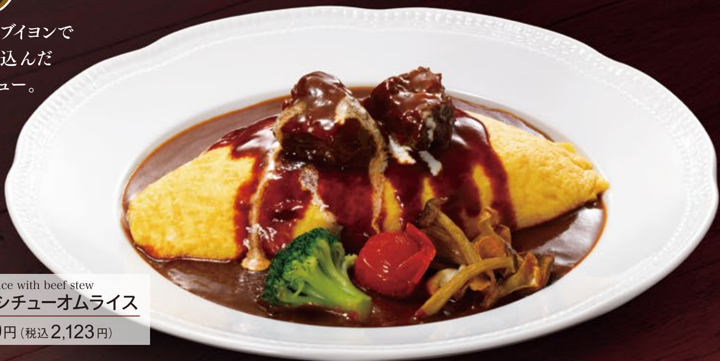
Omelet rice with beef stew ビーフシチューオムライス 1,930円 (税込 2,123円)