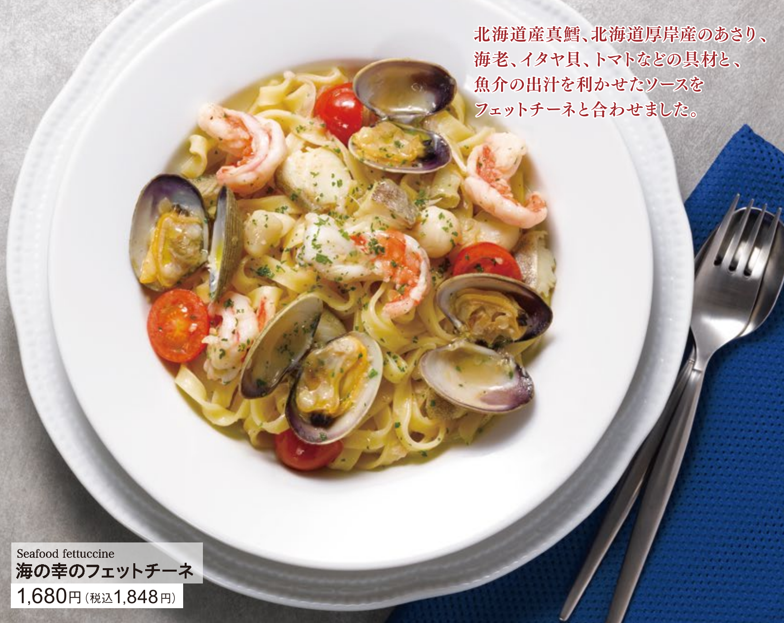
Seafood fettuccine 海の幸のフェットチーネ 1,680円(税込1,848円)

北海道産真鱈、北海道厚岸産のあさり、海老、イタヤ貝、トマトなどの具材と、魚介の出汁を利かせたソースをフェットチーネと合わせました。