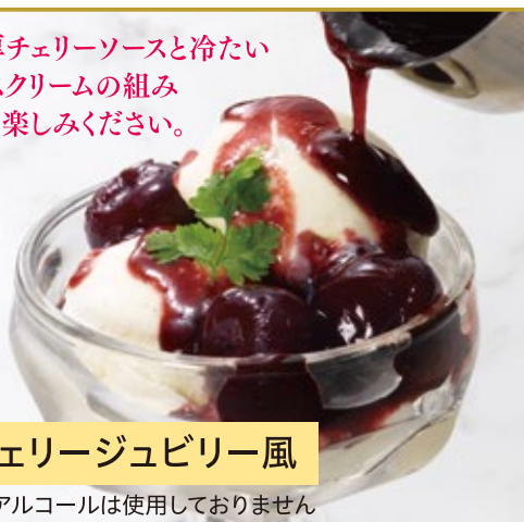
プチチェリージュビリー風

温かい濃厚チェリーソースと冷たい バニラアイスクリームの組み 合わせをお楽しみください。