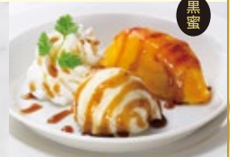
スイートポテトとバニラブルボン