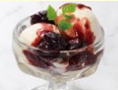
プチチェリージュビリー風

選べるプチデザートはプラス250円(税込275円) でプレミアムプチデザートセットに替えられます。