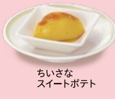
ちいさな スイートポテト