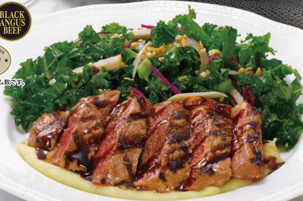
Black Angus sirloin steak and salad アンガスサーロインステーキサラダ 2,480円 (税込2,728円)