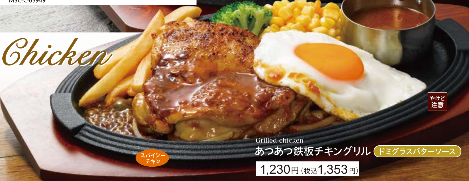
Grilled chicken あつあつ鉄板チキングリル ドミグラスバターソース