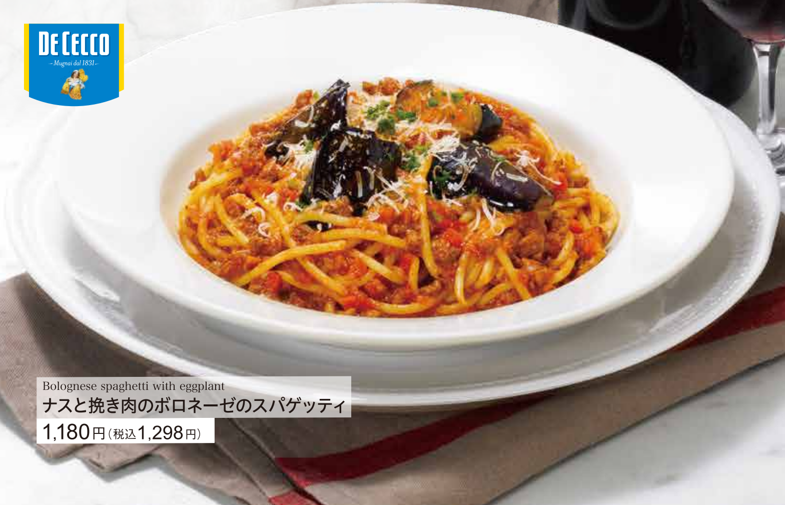
Bolognese spaghetti with eggplant ナスと挽き肉のボロネーゼのスパゲッティ 1,180円(税込1,298円)

Bolognese spaghetti with eggplant ナスと挽き肉のボロネーゼのスパゲッティ ケールサラダ・デザートセット