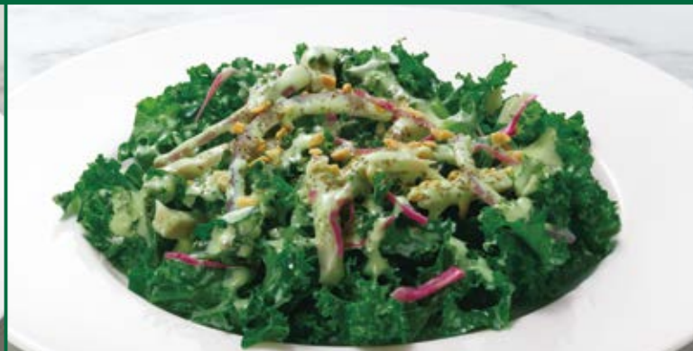
Kale salad with Green Goddess dressing ケールサラダ グリーンゴッドズドレッシング 680円 (税込748円)