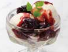
プチチェリージュビリー風

選べるプチデザートは プラス 250円(税込275円) でプレミアムプチデザートセットに替えられます。