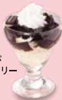
ほろにが カフェゼリー