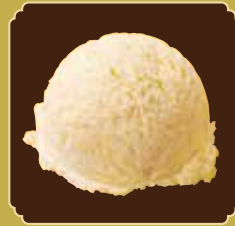
Vanilla bourbon バニラブルボン

ロイヤルホストのアイスは 美味しさにこだわった ベルギー産アイスを 使っています。