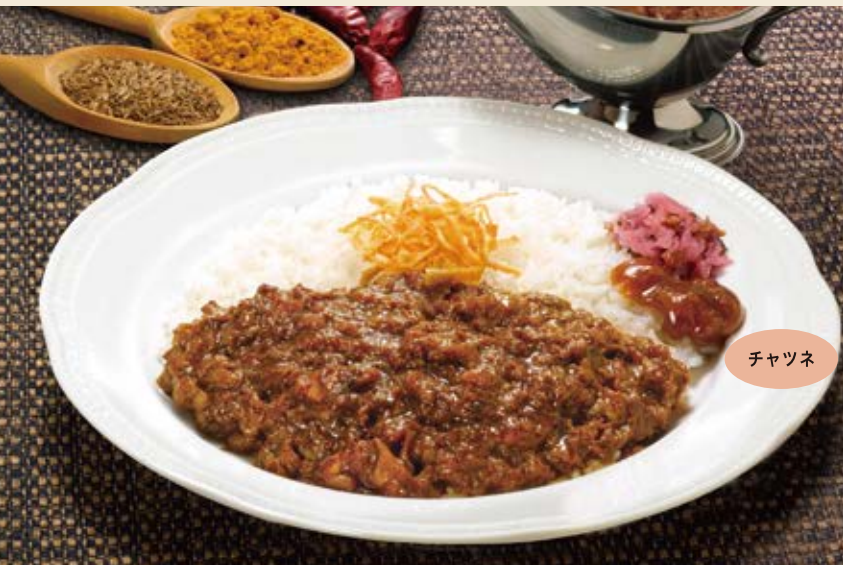
Beef Java curry ビーフジャワカレー