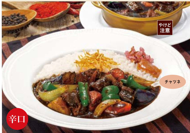
Kashmir beef curry カシミールビーフカレー