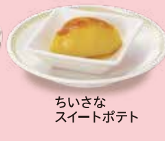
ちいさな スイートポテト