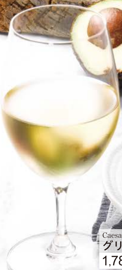
Caesar salad with grilled salmon and shrimp グリルサーモン・海老&アボカドのシーザーサラダ 1,780円 (税込1,958円)