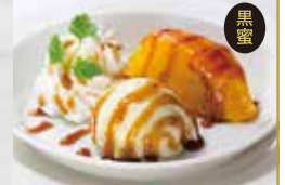
スイートポテトとバニラブルボン

お得なお食事セット 単品350円(税込385円) 以上のお食事をご注文の方へのお得なセットです。