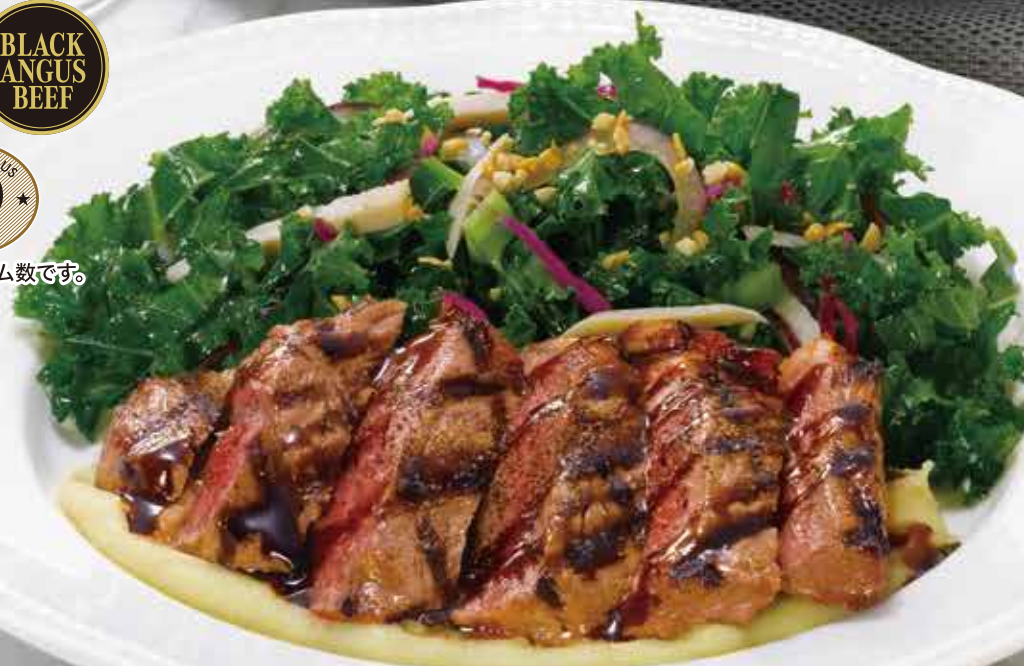
Black Angus sirloin steak and salad アンガスサーロインステーキサラダ 2,630円(税込2,893円)