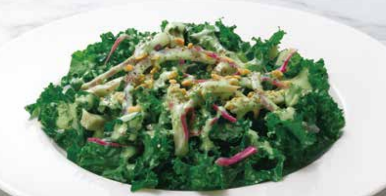
Kale salad with Green Goddess dressing ケールサラダ グリーンゴッドズドレッシング 680円(税込748円)