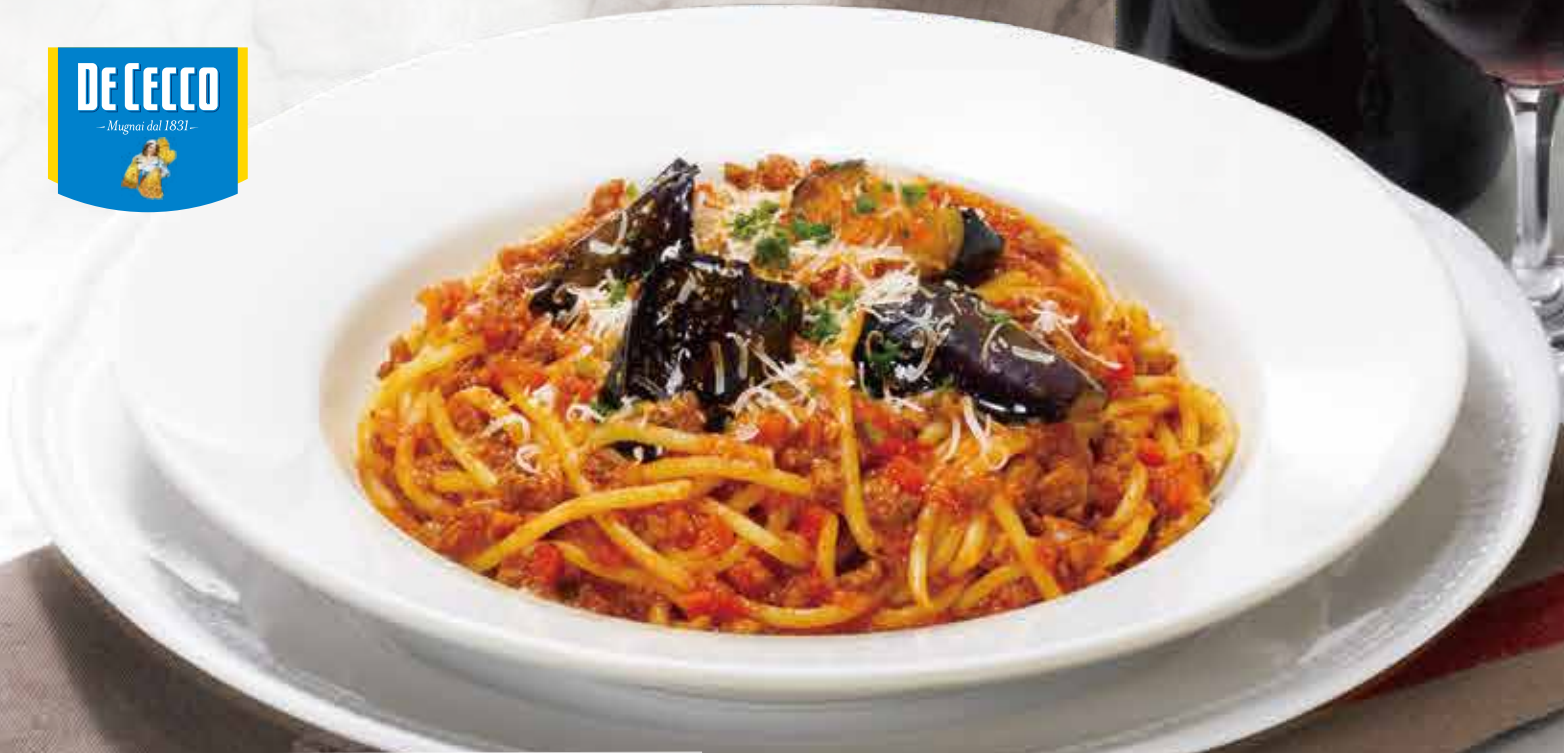
Bolognese spaghetti with eggplant ナスと挽き肉のボロネーゼのスパゲッティ 1,180円(税込1,298円)

Bolognese spaghetti with eggplant ナスと挽き肉のボロネーゼのスパゲッティ ケールサラダ・デザートセット