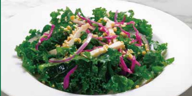
Kale salad with peanut oil dressing ケールサラダ ピーナッツオイルドレッシング 680円(税込748円)