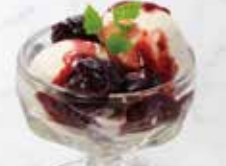
プチチェリージュビリー風

選べるプチデザートは プラス 250円(税込275円) でプレミアムプチデザートセットに替えられます。