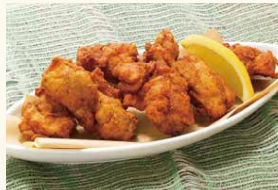
Fried chicken フライドチキン 680円(税込748円)