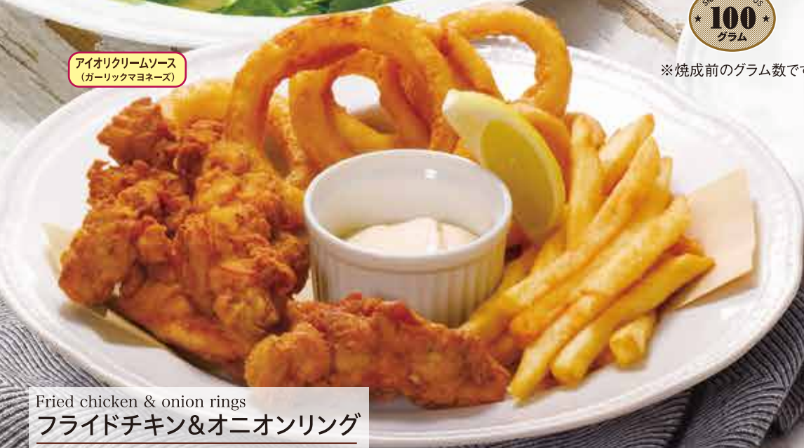
Fried chicken & onion rings フライドチキン&オニオンリング 1,380円(税込1,518円)