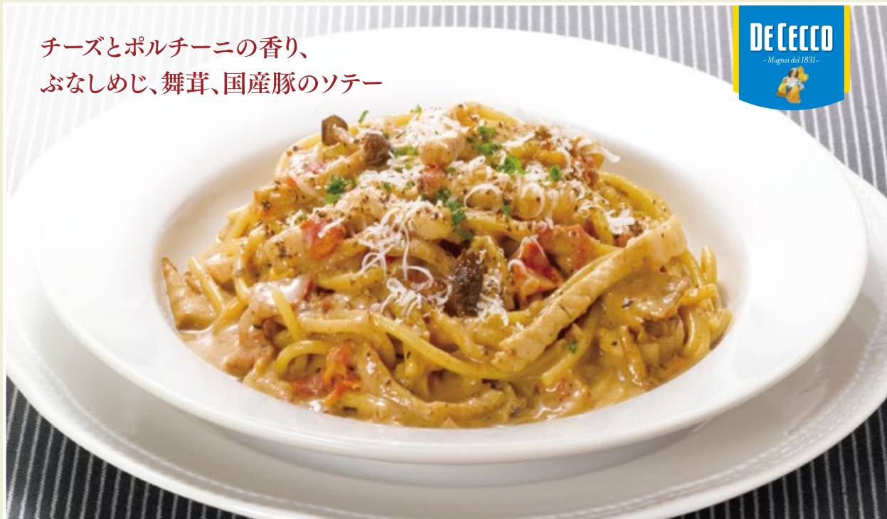
Porcini cream spaghetti with domestic pork and mushrooms 国産豚ときのこのポルチーニクリームソース