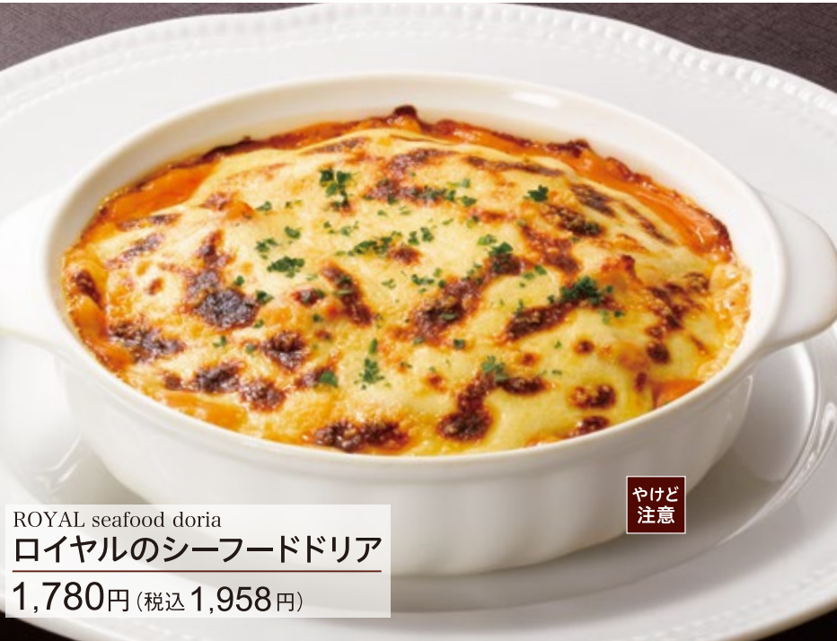
ROYAL seafood doria ロイヤルのシーフードドリア