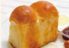
モーニング英国風パン