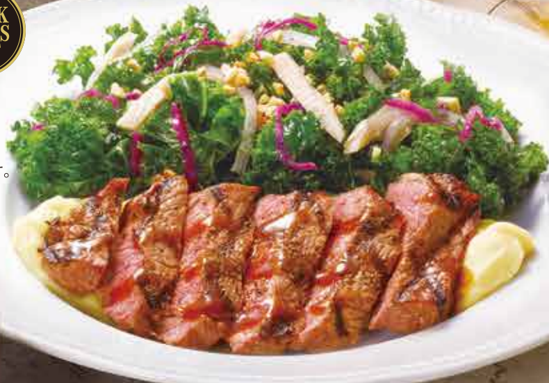
Black Angus sirloin steak and salad アンガスサーロインステーキサラダ グレイビーソース 2,880円(税込3,168円)