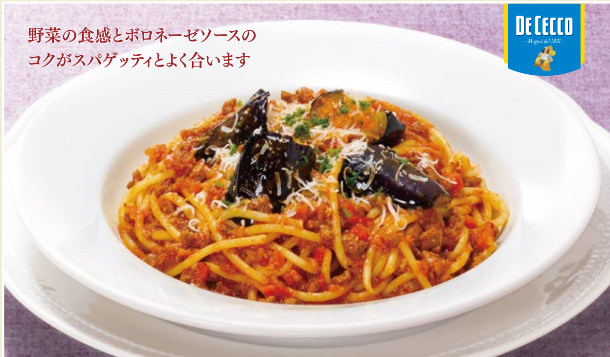
Bolognese spaghetti with eggplant ナスと挽き肉のボロネーゼ