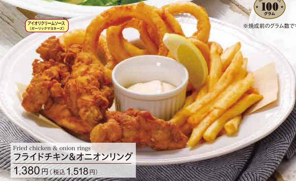
Fried chicken & onion rings フライドチキン&オニオンリング 1,380円(税込1,518円)