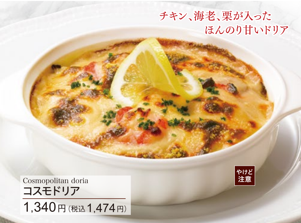
Cosmopolitan doria コスモドリア