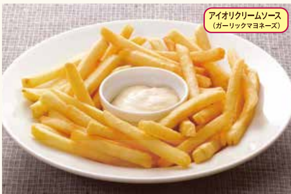
French fries with garlic mayonnaise sauce フライドポテト 580円(税込638円)