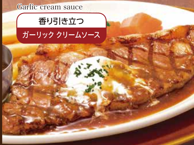
Garlic cream sauce