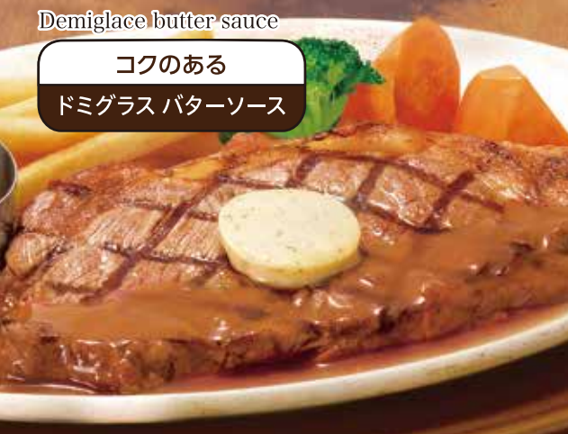
Demiglace butter sauce