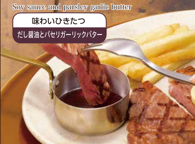
Soy sauce and parsley garlic butter