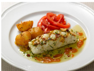
「メルルーサのグリル～オリオ風～」