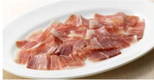
「ハブーゴ村のハモン・イベリコ・デ・ベジョータ」

ひと口サイズの串刺し料理と手でつまんで食べる「ピンチョ」4種の盛合せ。「ヒルダ」と呼ばれるギンディージャ(青唐辛子の酢漬け)とアンチョビ、オリーブでつくるパルの代表的なピンチョのほか、生ハム、鱈のコロッケ、チョコリとスモークサーモンのピンチョをご用意しました。