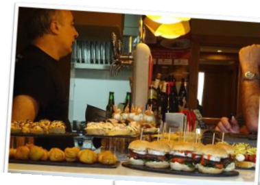
タパスやピンチョスが並ぶ「バル」

美食の街 サン・セバスチャンには、一品料理がカウンターに並ぶ「バル」がおよそ400軒あると言われています。地元の人々は朝食・昼食・おやつ・夕食と一日を通して「バル」を利用しており、第二の我が家の食卓とも言える存在です。「バル」のカウンターには、タパス(小皿料理)や、ピンチョス(タパスの中でも串がささったひと口サイズの料理)が所狭しと並び、人々は食べたいメニューを複数注文します。ただし一軒に長居はせず3軒以上ハシゴし、どの店でもバスク地方のさっぱりとしたかすかな泡立ちを感じる白ワイン、チャコリを飲むという「バル巡り」を粋に楽しむのがバスク流です。