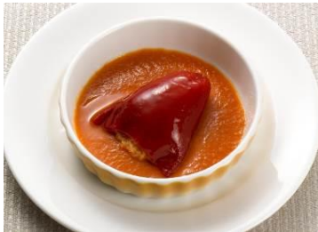
「ずわい蟹のピキージョ〜ビスカヤソース〜」

どんぐりを食べて育ったイベリコ豚のみを使い、職人による伝統的な製法でつくられる味と香りが格別な高品質の生ハム。チルドの状態で購入し、お店でスライスしてご提供します。