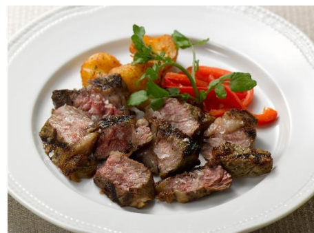
「アンガスビーフのグリル〜美食倶楽部風〜」

鱈の一種であるメルルーサをグリルし、ガーリックと唐辛子、白ワインビネガーを加えたオリーブオイルのソースで仕上げます。赤ピーマンを使ったソースがアクセント。