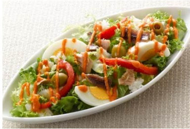
「鱈とアンチョビのロメスコサラダ」

詰め物をした小ぶりの烏賊をシンプルにグリル。魚介の旨みあふれるイカ墨のソースと絡めていただきます。