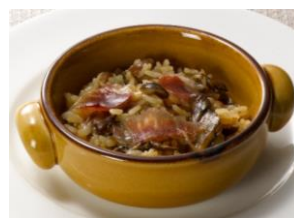
「あざりと帆立のバスク風おじや」(写真左)