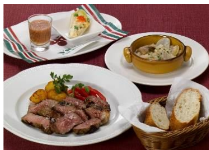
「アンガスビーフのグリル～美食倶楽部風～」 美食倶楽部セット