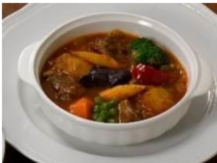
「ラム肉のバスク風煮込み」

香ばしくグリルしたアンガスビーフに粗塩をふり、素材の味をシンプルに楽しむバスク美食倶楽部スタイルの食べ方でご提供します。