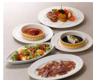
「バル」スタイルイメージ

串に刺したり手でつまんでひと口で食べる料理、ピンチョを盛合せた「4種のピンチョス」、バスク地方の名物料理「ずわい蟹のピキージョ～ビスカヤソース～」や、味と香りが格別な生ハム「ハモン・イベリコ・デ・ベジョータ」など、自由に組合せを楽しむ「バル」の小皿料理・タパスをご用意しました。