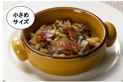
「きのこ生ハムのバスク風おじや」