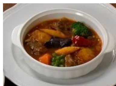
「ラム肉のバスク風煮込み」