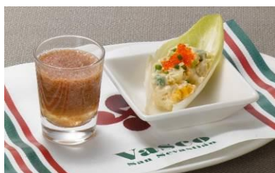
「ガスパチョ&ポテトサラダのピンチョ」

7 種の国産野菜でつくった冷製スープ「ガスパチョ」と、チコリにのせたポテトサラダをピンチョスタイルで楽しむ一品。