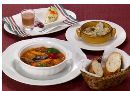
「ラム肉のバスク風煮込み」 美食倶楽部セット