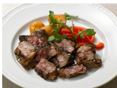
「アンガスビーフのグリル ～美食倶楽部風～」