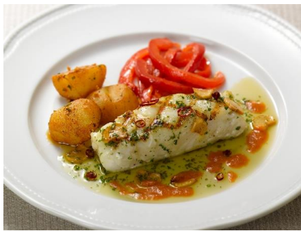
「メルルーサのグリル〜オリオ風〜」