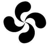
バスクのシンボル:ローブリュー