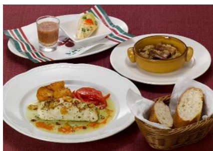
「メルルーサのグリル～オリオ風～」 美食倶楽部セット

今回のフェアでは、「バスク風おじや」と「メイン料理」が選べるセットのスタイルでご提供します。 前菜、バスク風おじやとバゲット、メイン料理をお好きな組合せでお楽しみください。