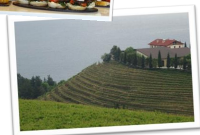
チャコリを生産するワイン畑