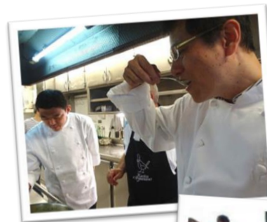
「美食倶楽部」の様子

「美食倶楽部」誕生の背景には、歴史的にバスク語の使用を制限されていた時代があり、バスクの文化や慣習を皆で守り繋いでいこうという想いがあったとも言われています。バスク地方の人々は、ともに分かち合う精神を大事にしており、「美食倶楽部」でもお互いに料理を教え合うなど、レシピや料理に関する情報はオープンにされています。「共に作り」「共に食べ」「共に語らう」精神が代々伝承され、「美食倶楽部」は現在まで100年以上続いてきました。